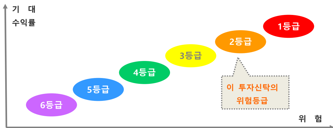
〈한화자산운용 투자위험등급 기준〉

※ 상기 위험등급 기준은 한화자산운용(주)의 자체적인 기준으로서 투자자가 판단하는 기준 또는 판매회사의 기준과 일치하지 않을 수 있습니다.